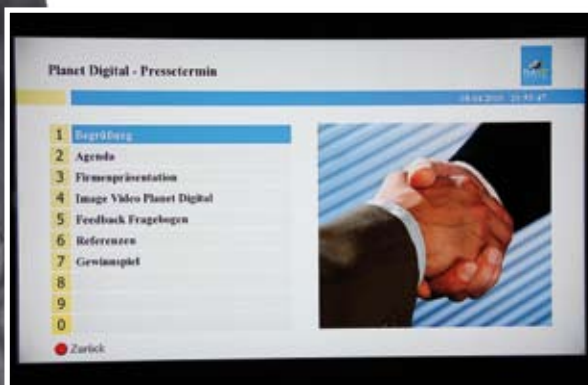
Präsentationen von Firmen im Hotel werden auch über das Hotel-TV verbreitet.