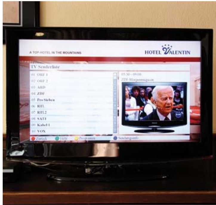
Durch die Digitalisierung kann der Gast jede Sendung aller Kanäle sehen, wann und wie oft er will (Time-Shift-Funktion).